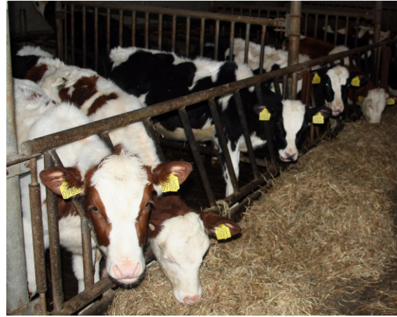
Een hok vol Bio Opneij Wytze's →

Wytze (RHF), 1300 rietjes verkocht en van de andere vier stieren, Bio Proostmeer Henkie Boy (HF), Bio Classic Jaap (HF), Bio Nieuw Bromo Jeroen (GB x HF) en Bio Arkenheem 110 (FH), gemiddeld 250 dosis per stier. Een mooi resultaat en uniek in de wereld maar het zou nog best wat meer mogen zijn. Tijdens de BioVak kan natuurlijk ook sperma worden besteld. (WN).